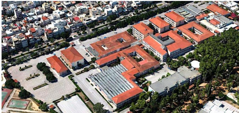
Εικόνα 1: Οι εγκαταστάσεις του εκτείνονται στα κτήρια Κ6, Κ7 του ΠΑΔΑ και Σχεδιάγραμμα Πανεπιστημιούπολης Άλσους Αιγάλεω και αρίθμηση κτηρίων